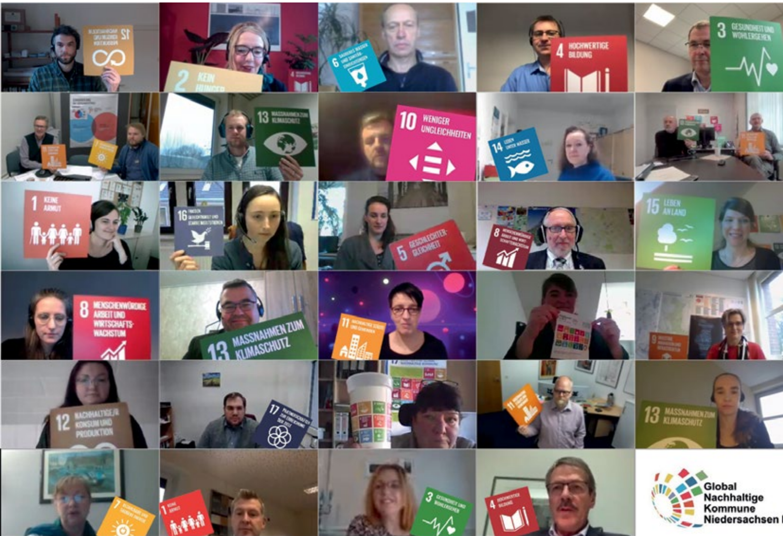
Erstes digitales Vernetzungstreffen am 10.12.2020