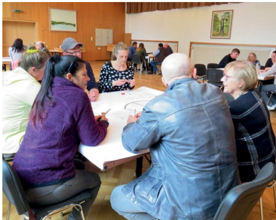
In Flechtorf (rechts) fand bereits ein Leitbild-Workshop statt, in Lehre (li.) ist er jetzt geplant.