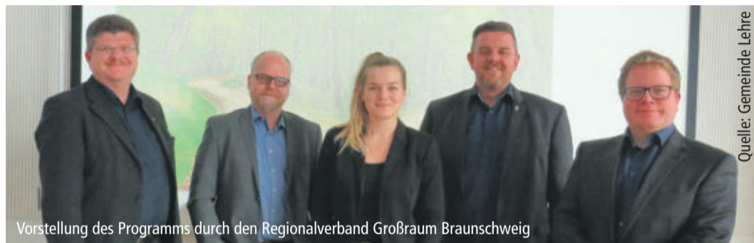
Vorstellung des Programms durch den Regionalverband Großraum Braunschweig

LEHRE Aktiver Klimaschutz in der Gemeinde – Vorstellung war Ende Februar