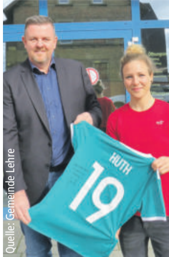
Svenja Huth überreicht ein signiertes Trikot an den Bürgermeister