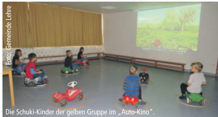
Die Schuki-Kinder der gelben Gruppe im „Auto-Kino“.

In diesem Jahr laufen sogar die traditionellen Veranstaltungen etwas anders ab als gewohnt, so auch die Verabschiedung der künftigen Schulkinder aus den Kindertagesstätten. Wegen