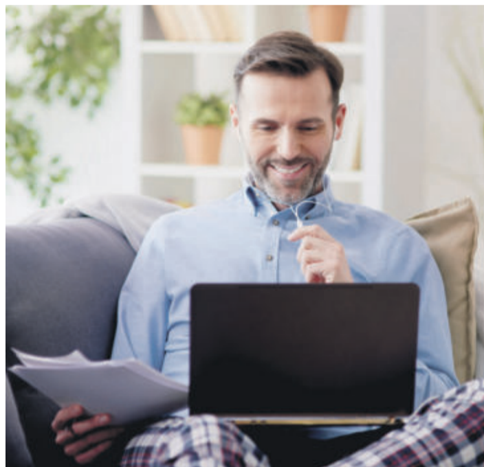
Sicherheit im Leben bringt viel Gutes mit sich. Kümmern Sie sich rechtzeitig.

RATGEBER Sanierung eines Einfamilienhauses und gleich die passende Versicherung dazu