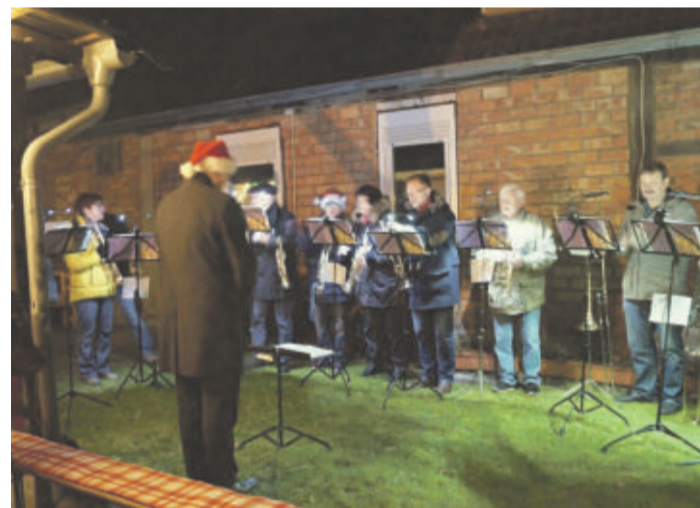
Wie hier 2016 wird der Posaunenchor beim Adventsfenster auch in diesem Jahr auf das Weihnachtsfest einstimmen