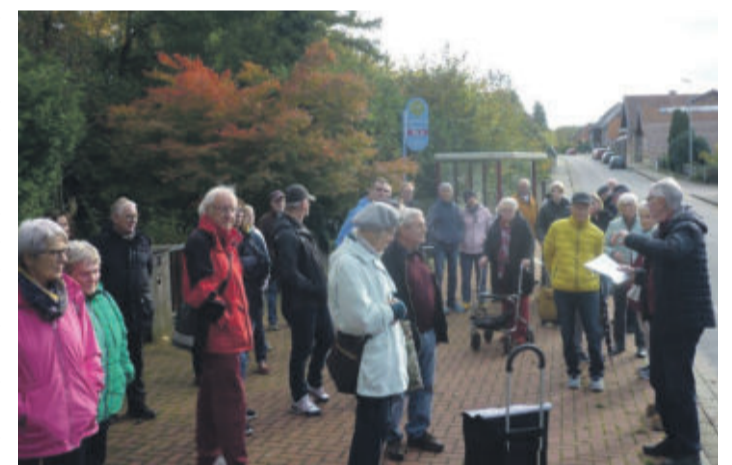
Foto1: Beim Ortsrundgang

So war es für alle Beteiligten ein gelungener Nachmittag. Dies bestätigt die positive Resonanz und ein gut ge-