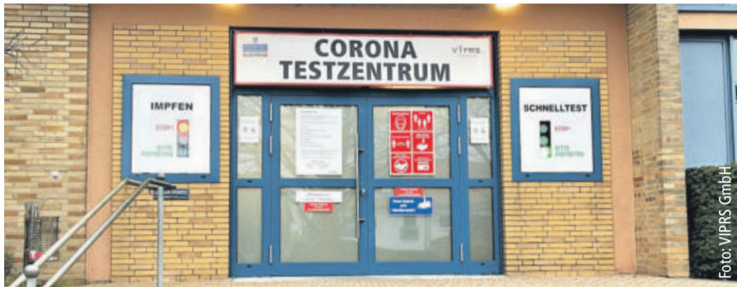
Im Testzentrum Flechtorf darf jetzt auch geimpft werden.

FLECHTORF Abschließende Abstimmungen mit der Gemeinde Lehre erfolgen aktuell