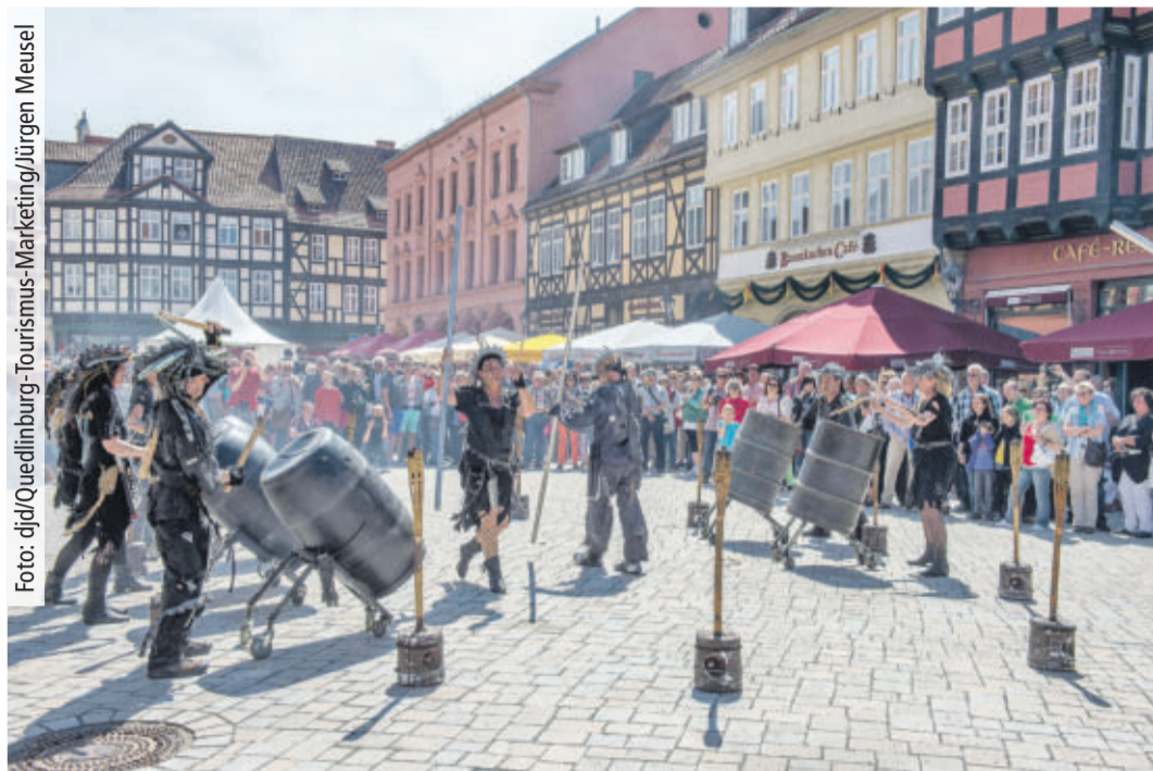
Bei den "Hoftagen" nach Ostern und den "Königstagen" im Juni verwandelt sich die historische Altstadt von Quedlinburg in eine große Bühne.

AUSFLUG Eine Städtereise nach Quedlinburg und Goslar zum 1.100-jährigen Jubiläum