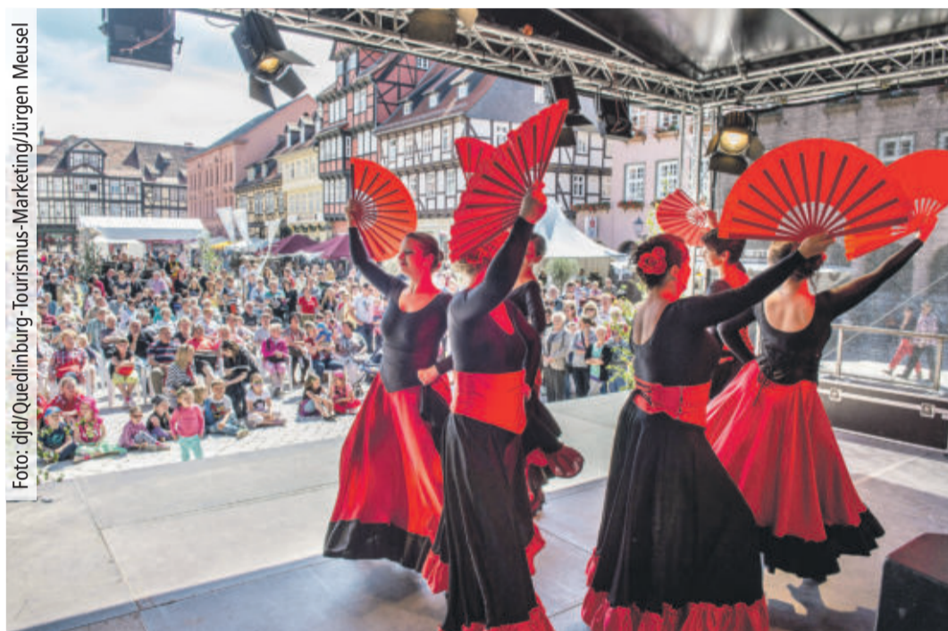
In Quedlinburg sind 2022 zwei mehrtägige Stadtfeste mit abwechslungsreichen Bühnenprogrammen, historischen Festumzügen und viel Mittelalterflair geplant.

(djd). Über ein Drittel der Menschen in Deutschland hat 2020 laut Verbrauchs- und Medienanalyse (VuMA) eine mehrtägige Städtereise unternommen. Der Trend zum Kurzurlaub dürfte anhalten, und zu den besonders lohnenden Zielen im Jahr 2022 zählen geschichtsträchtige Fachwerk-Kleinstädte wie Goslar und Quedlinburg. Die Weltkulturerbe-Städte liegen am nordwestlichen beziehungsweise nordöstlichen Rand des Harzes und feiern beide ihre erste urkundliche Erwähnung vor 1.100 Jahren mit einem abwechslungsreichen Kulturprogramm. Hier wie dort sind mehrtägige Stadtfeste, historische Festumzüge und Open-Air-Veranstaltungen geplant, die Besucher auf spannende Zeitreisen einladen.