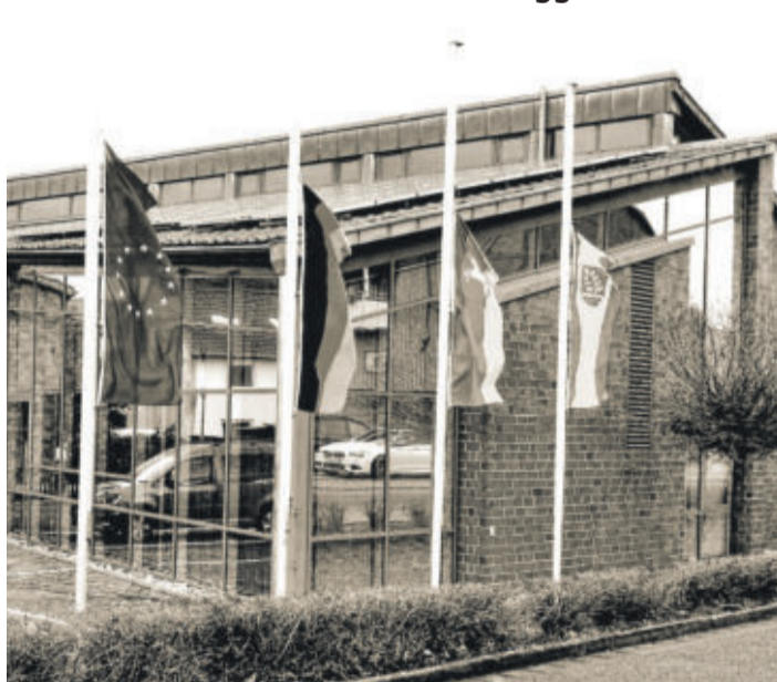
Die Flaggen vor dem Rathaus wehen am 20. Januar 2022 auf halbmast.

LEHRE Flaggen am Rathaus der Gemeinde auf halbmast