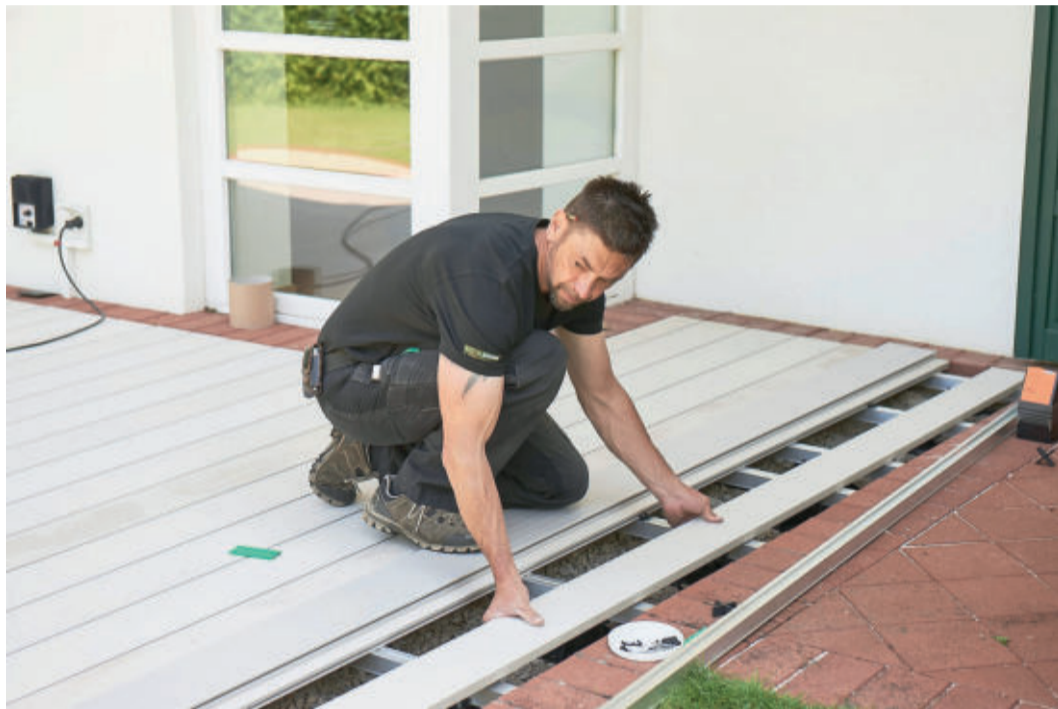
Zuerst ein Schotterbett, dann eine Unterkonstruktion, zum Schluss die WPC-Dielen: So baut man eine Terrasse fachgerecht auf.

WAS MAN BEI UNTERKONSTRUKTION UND DIELENVERLEGUNG BEACHTEN SOLLTE