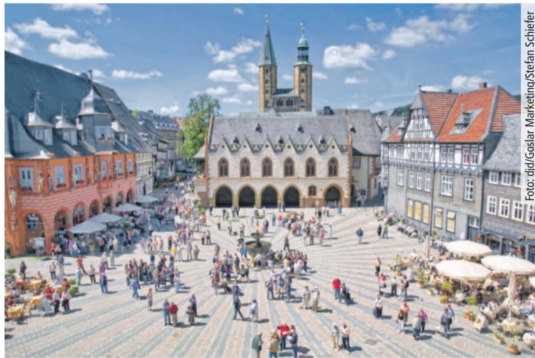
Die Altstadt von Goslar, Teil des Unesco-Weltkulturerbes, ist 2022 Schauplatz von Jubiläumsfeierlichkeiten.