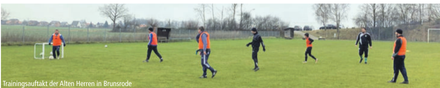
Trainingsauftakt der Alten Herren in Brunsrode

LEHRE Alte Herren des FC Schunter haben viel vor