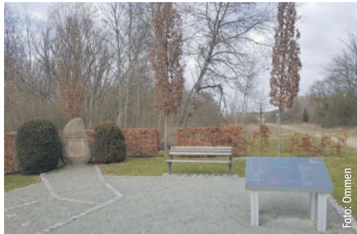
Gedenkstätte KZ Schandelahe Wohlh

LEHRE Zu den Erinnerungsstätten der NS-Zeit