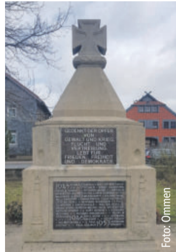
Kriegerdenkmal mit neuer Gedenktafel von 2020