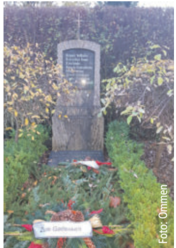
Gedenkstätte für sowjet. Opfer in der Muna Lehre