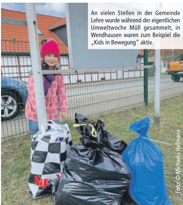
An vielen Stellen in der Gemeinde Lehre wurde während der eigentlichen Umweltwoche Müll gesammelt, in Wendhausen waren zum Beispiel die „Kids in Bewegung“ aktiv.

LEHRE Tolles Engagement trotz Absage der Umweltwoche