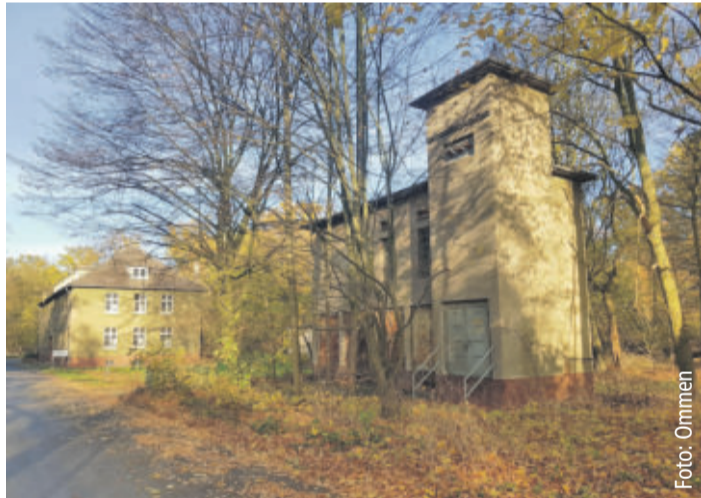
Ehemalige Energiezentrale der Muna Lehre