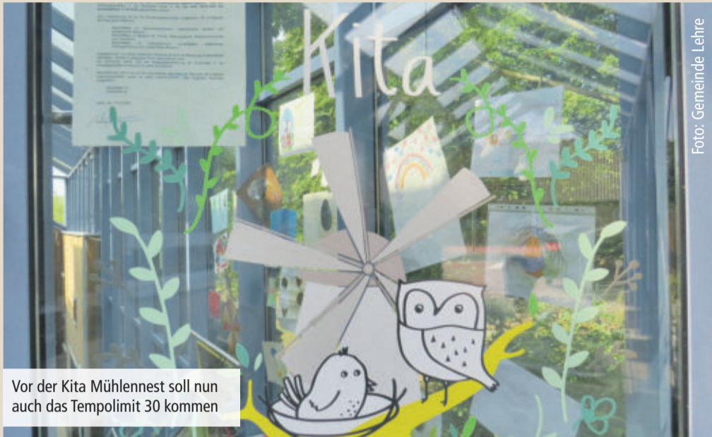
Vor der Kita Mühlennest soll nun auch das Tempolimit 30 kommen

Bereits 2017 wurde durch die Änderung der Verwaltungsvorschriften zur StVO die Möglichkeit eröffnet, dass an Schulen, Kitas, Krankenhäusern sowie Altenheimen unter bestimmten Bedingungen die Geschwindigkeit runtergesetzt werden kann. Im Laufe der nächsten Wochen werden dann die entsprechenden Verkehrszeichen vom Landkreis Helmstedt vor der Kita Mühlennest abgebracht.