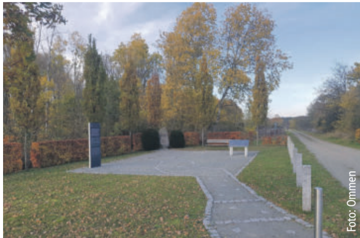
Gedenkstätte KZ Schandelahe Wohlh