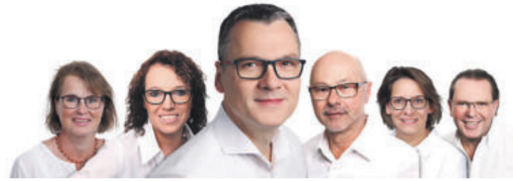
Das kompetente Team von Augenoptik Bock.

Bei einer Sehbehinderung oder Sehbeeinträchtigung spricht man immer häufiger von "Low Vision", was "geringeres Sehen" bedeutet. Low Vision tritt ein, wenn die Sehleistung kleiner als 30 Prozent ist. Dabei kommt eine Sehbeeinträchtigung nicht nur bei älteren Menschen vor. Die Ausprägungen einer Sehbehinderung können einen unterschiedlichen Charakter aufweisen, deswegen ist die Vielfältigkeit des Angebots an Hilfsmitteln besonders wichtig. Wenn die normale Brille nicht mehr ausreichend ist und Lesen, Schreiben, Arbeiten am PC sowie Fernsehen nicht mehr optimal sind, können hochwirksame Sehhilfen, die Vergrößern und eine bessere Ausleuchtung schaffen, gegen die Beeinträchtigung im Alltag hilfreich sein.