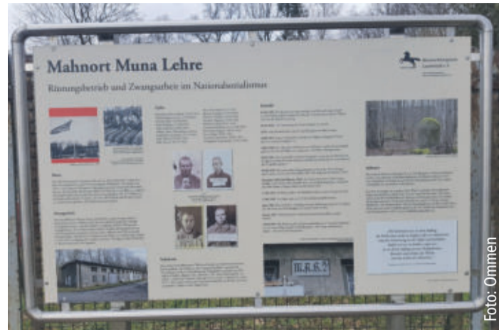
Gedenktafel „Mahnort Muna Lehre“