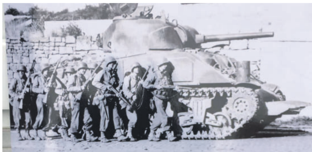
Soldaten des 8. US-Infanterieregiments befreien Lehre – hier bei ihrem Vormarsch im September 1944 in Belgien

LEHRE US-Truppen befreien am 11. April vor 76 Jahren Lehre und am Tag danach die Muna