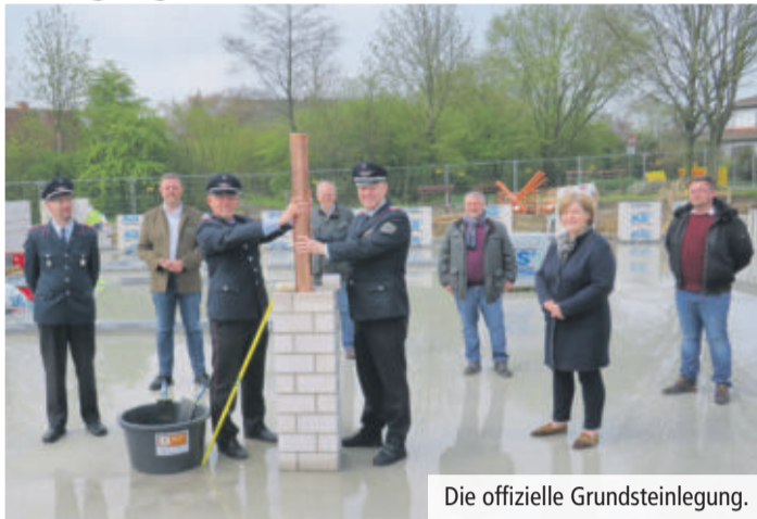
Die offizielle Grundsteinlegung.

Groß Brunsrode bekommt ein neues Feuerwehrgerätehaus. Jetzt wurde offiziell die Grundsteinlegung vollzogen. Ziel ist, dass das neue Feuerwehrgerätehaus im kommenden Frühjahr bezogen werden kann.