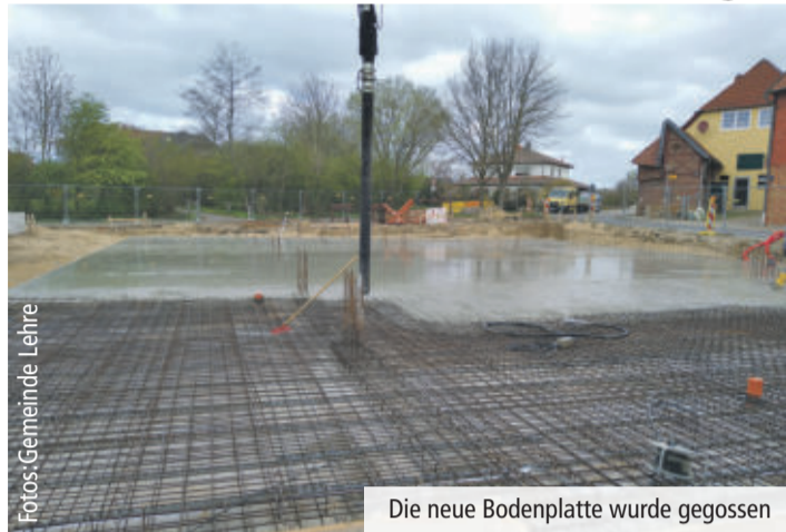
Die neue Bodenplatte wurde gegossen

GROSS BRUNSRÖDE Grundstein für Feuerwehrgerätehaus gelegt