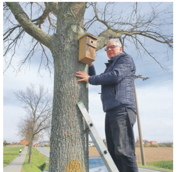
der und Patenschaften von Nistkästen können sich unter der Telefon-Nr. 05308 3826 melden.

Entlang des Weges stehen etwa 25 Eichen, die zum Teil befallen sind. „Jeder im Ort, der sich ebenfalls dafür einsetzen möchte, kann mitmachen.“ Spen-