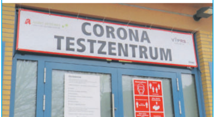
Testzentrum in Flechtorf