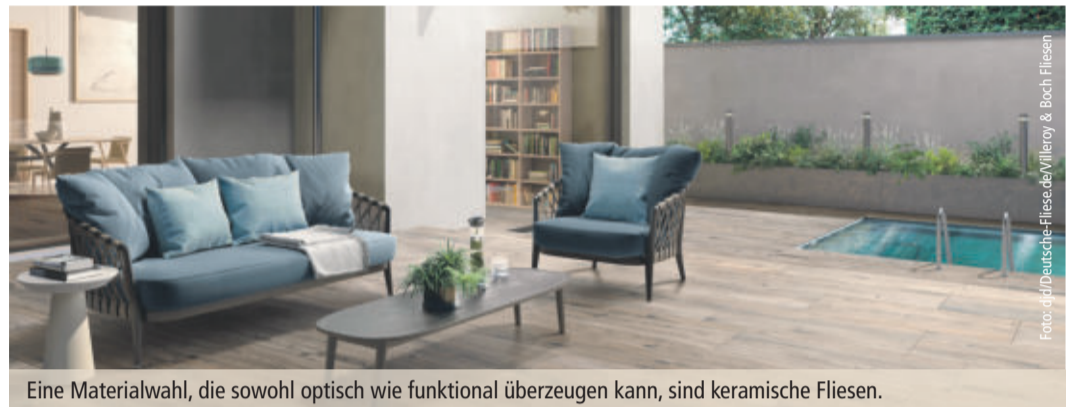
Eine Materialwahl, die sowohl optisch wie funktional überzeugen kann, sind keramische Fliesen.

Bodenbeläge aus Holz oder Holzverbundstoffen bieten eine natürliche Optik. Der Verwitterungsprozess durch Sonneneinstrahlung, Nässe und Kälte kann bei Echtholz allerdings nur durch Einsatz von chemischen Pflegemitteln verzögert werden. Bei starker Versprö-