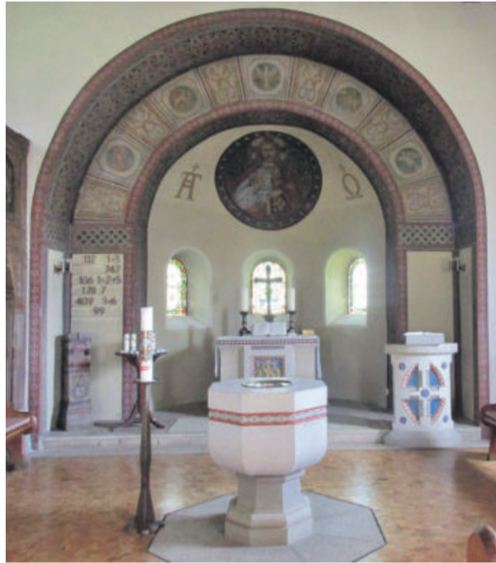
Blick in die schicke Kirche

Ein besonderes Kleinod in unserer Gemeinde dürfte die St. Jürgen-Kirche in Beienrode sein, deren markanter, hoher schlanker Kirchturm schon von weit her zu sehen ist. Wann die Kirche errichtet worden ist, steht nicht eindeutig fest, vermutlich schon bald nach der Ansiedlung der ersten Bewohner um 1200, zunächst in Form einer einfachen Kapelle. Als die Einwohnerzahl in Beienrode zunahm und das