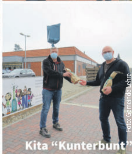
Der Ortsrat Lehre dankte den Einrichtungen seiner Ortschaft.