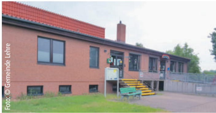
Die Turnhalle in Beienrode soll saniert werden.

Sanierung der Turnhalle in Beienrode. Jetzt liegt der Gemeinde auch eine offizielle Bestätigung vor.