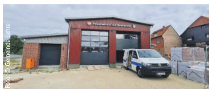
Der Neubau des Feuerwehrgerätehauses in Groß Brunsrode befindet sich in den Endzügen.

Der Bauausschuss der Gemeinde Lehre plant bereits seine nächste Sitzung im Gruppenraum des neuen Feuerwehrgerätehauses stattfinden zu las-