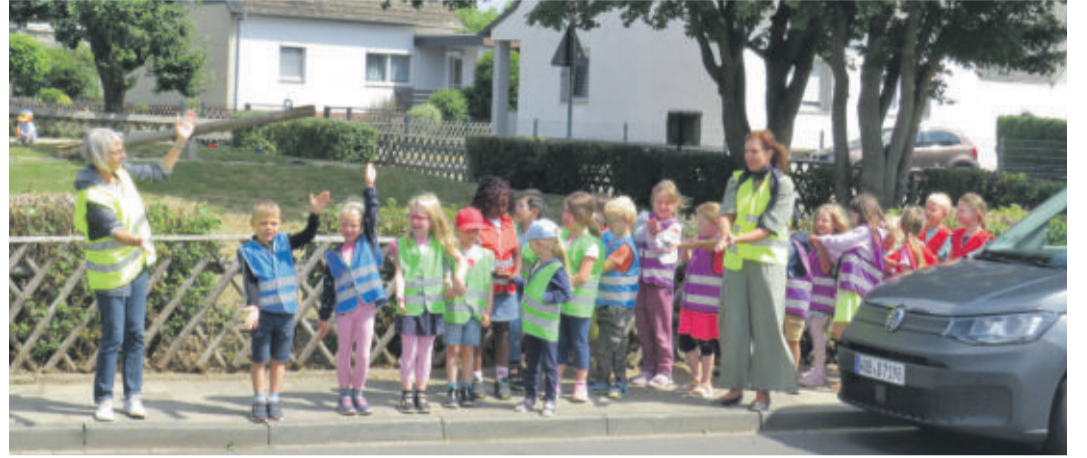
Für die Schulkinder in der Kita „An der Feuerwehr“ gab es einen gebührenden Abschluss mit einer Waldolympiade in Essehof, ein Verkehrs-Projekt und alle gemeinsam feierten ein sportliches Sommerfest.