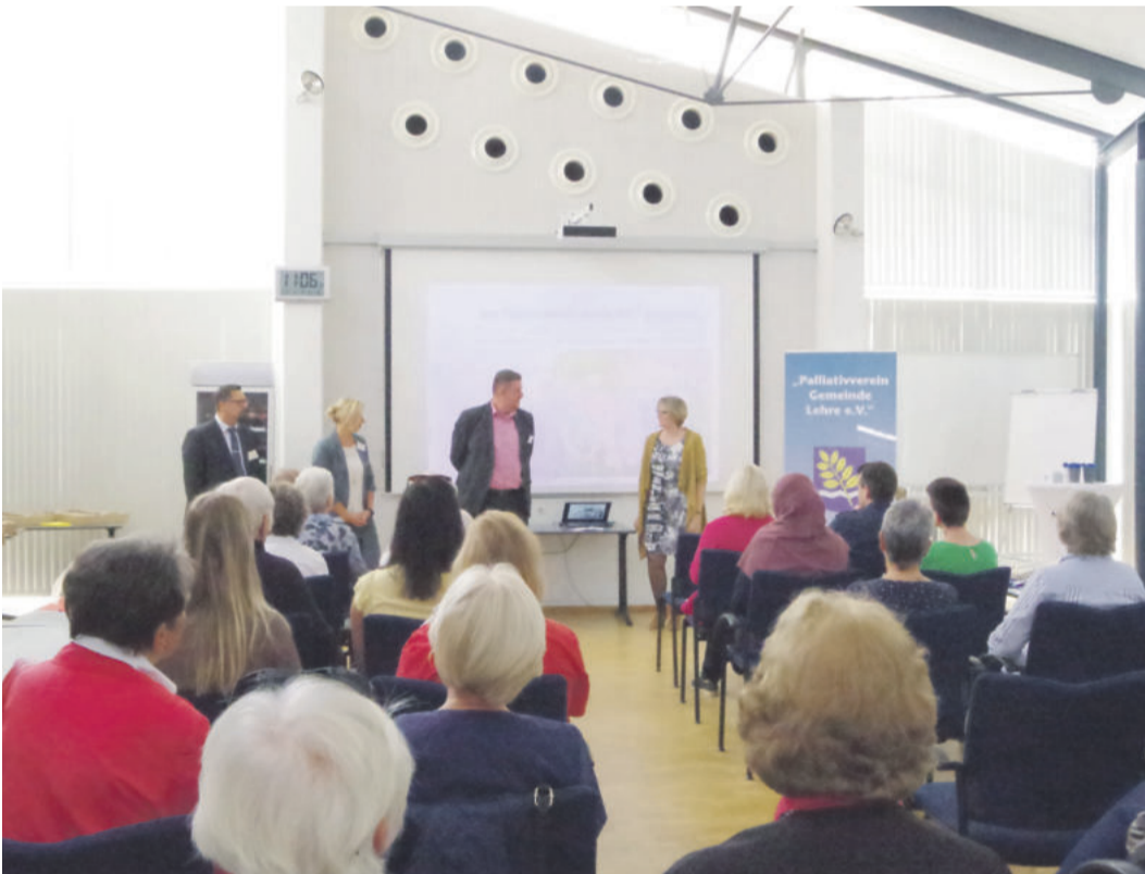
Der Vereinsvorstand eröffnet den 1. Palliativtag im September 2019 im Rathaus Lehre.

Am 8. Oktober findet von 11 bis 14 Uhr der 2. Palliativtag im und rund ums Rathaus in Lehre statt.