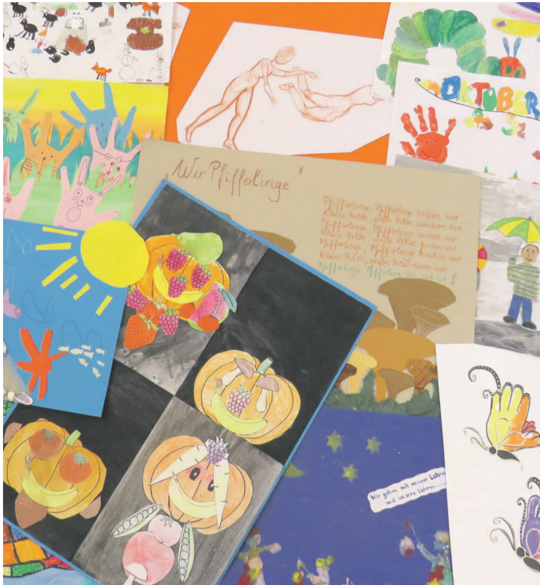
Titelblatt Kunstkalender 2023

LEHRE Erfolgreiches Projekt geht ins vierte Jahr