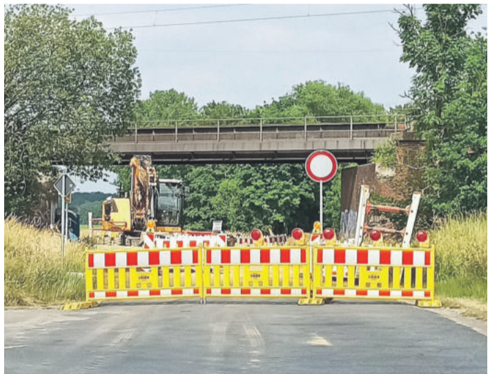
Aufgrund des zweigleisigen Ausbau der Eisenbahnstrecke „Weddeler Schleife“ besteht derzeit eine Vollsperrung in der Ehmener Straße.

KLEIN BRUNSRUDE Bauprojekt „Weddeler Schleife“