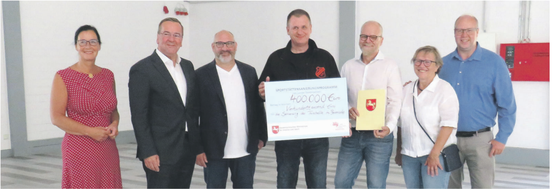
Übergabe der Bewilligungsbescheide aus dem Sportstättenanierungsprogramm vom Land Niedersachsen

BEIENRODE Innenminister Boris Pistorius in der Börnekenhalle