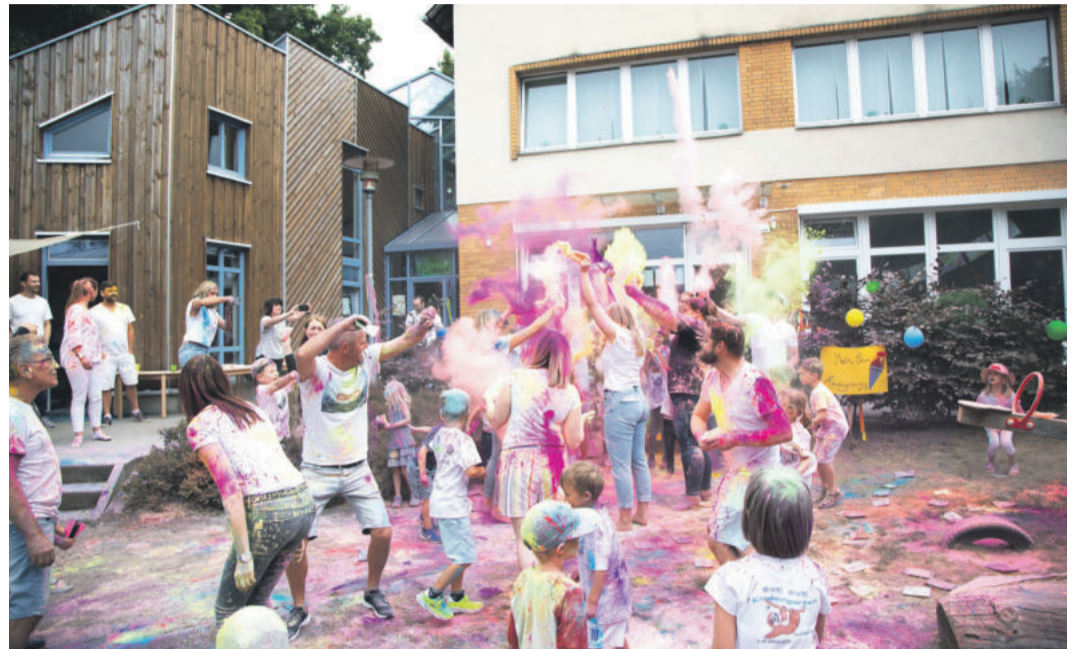
Zum Abschluss des Sommerfestes feierte die Kita „Mühlennest“ ein Holi-Festival.