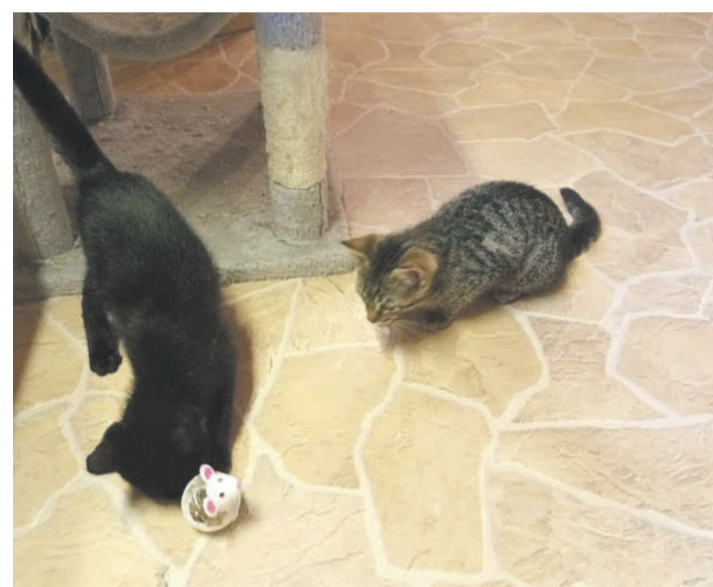
Aktuell suchen noch vier junge Kater und eine zurückhaltende etwa 5-jährige Katze ein Zuhause.

LEHRE Tierschutz freut sich über Unterstützung